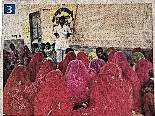
दिवस पर आयोजित 3 समदड़ी मजदूर दिवस पर महिला कार्मिकों को संबोधित करते वसुंधरा सेवा समिति के पदाधिकारी।