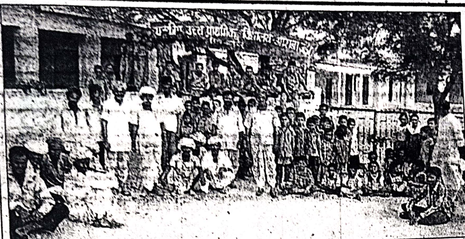
बालोतरा में विद्यालय प्रशासन की अनियमितताओं के विरोध में अराबा उड़ों के राजकीय उच्च प्राथमिक विद्यालय पर ताला जड़कर शुक्रवार को अनिश्चितकालीन धरने पर बैठे ग्रामीण।